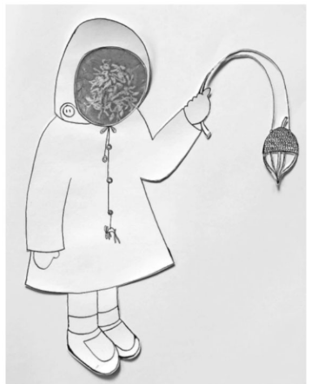
Meisje met hazengezichte en eikellampionnetje. TEKENING TRUDE HOL