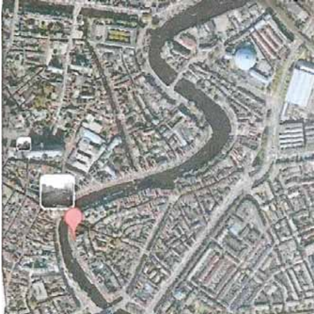
het spaarne - haarlem

het riviertje de Çaydere in emirdag heeft dezelfde bochten als het haarlemse Spaarne