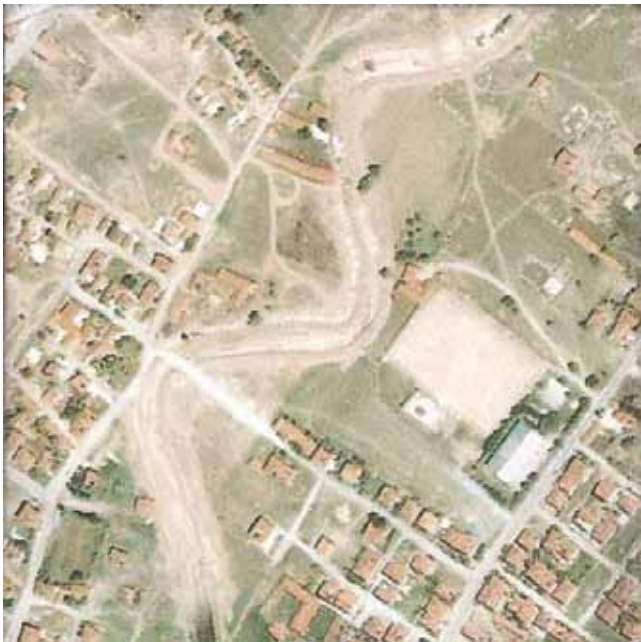
çaydere - emirdag